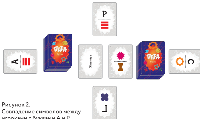
Рисунок 2. Совпадение символов между игроками с буквами А и Р