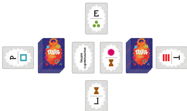
Рисунок 4. Все игроки придумывают слово, содержащее буквы Е, Т, Р и Г

Если никто из игроков не смог придумать ответ за 60 секунд, карта общего соревнования замешивается обратно в одну из стопок для взятия карт. После этого снова начинает действовать карта категории, опять оказавшаяся верхней в соответствующей стопке.