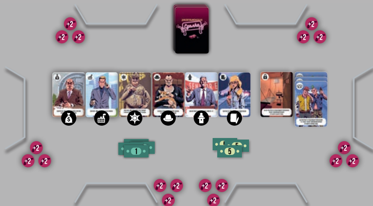
Пример начальной раскладки на 6 игроков