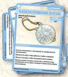
СТОПКА СБРОСА БЛАГОСЛОВЕНИЙ